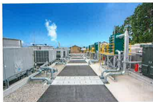
写真 「コスモテック別府バイナリー発電所」外観

地熱発電は季節や天候に左右されず、24時間安定した発電が可能で、ベースロード電源として電力自給率の向上にも貢献できる発電システムだが、大規模地熱発電所で採用されている地熱蒸気で直接タービンを回して発電するフラッシュ発電では200℃以上の高温高圧の蒸気が必要で、適用できる場所が限定的となるため